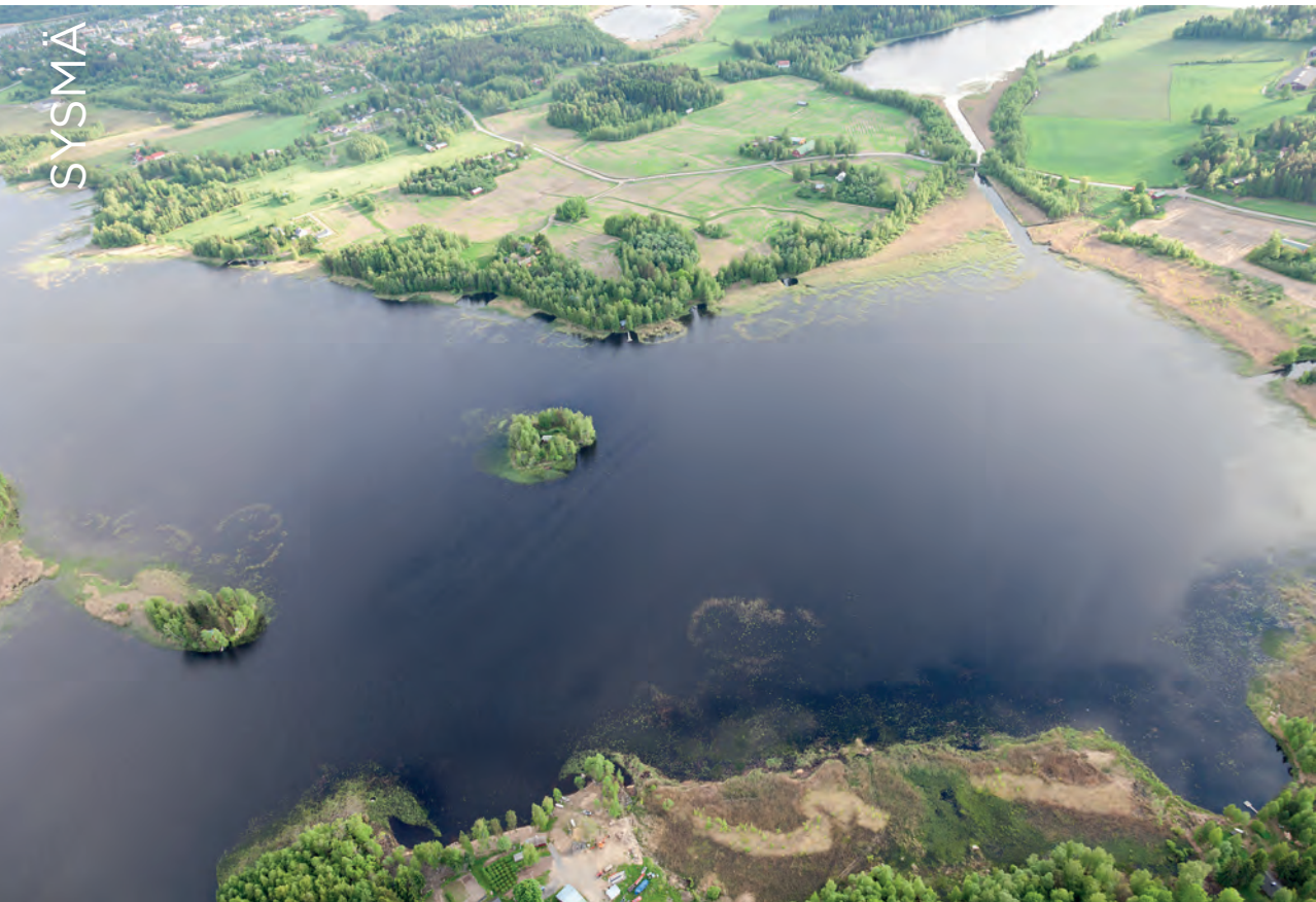
Ylä-Vehkajärvi ja Nuijanpohja. PK