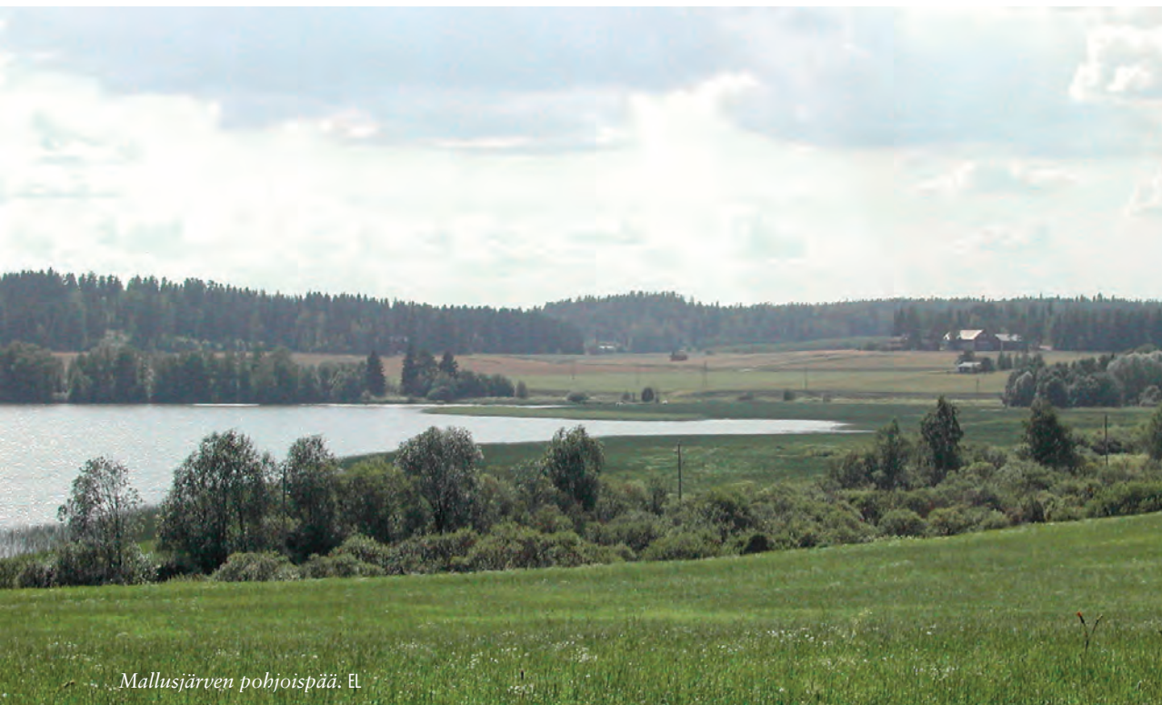
Mallusjärven pohjoispää. EL

Kilometrin päässä järveltä sijaitseva Mallusjoen vanha metsä tunnetaan pohjantikoistaan, jotka ilmei-