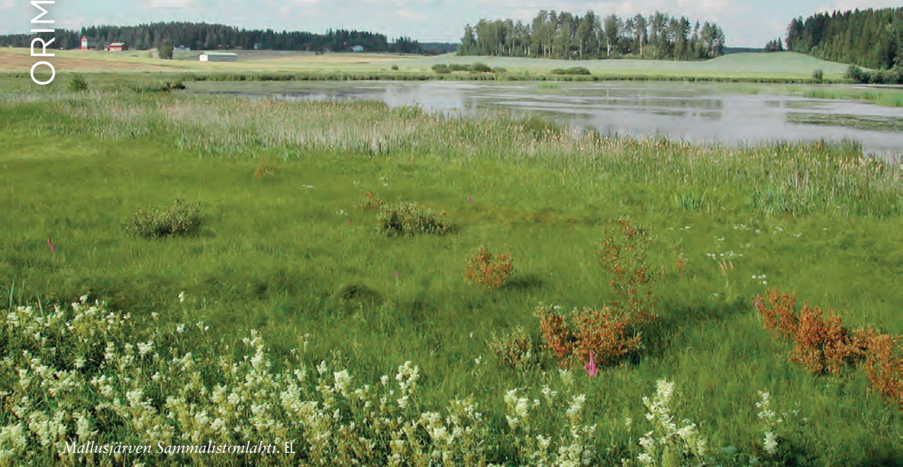
Mallusjärven Sammalistonlahti. EL