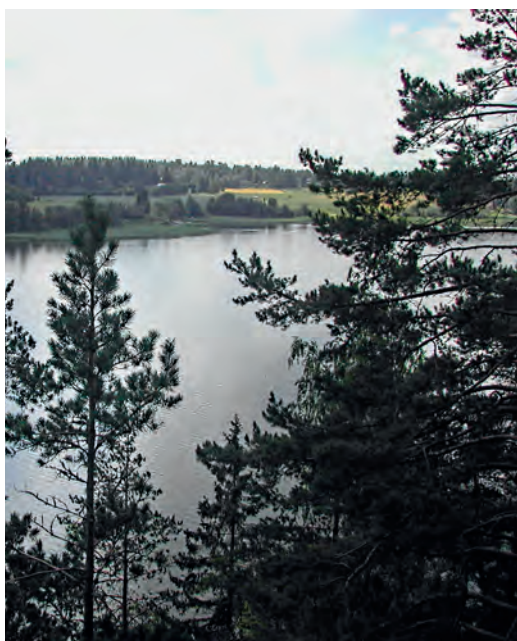
Mallusjärven itäpäätä. EL

TYYPPILAJIT Laujuloutsen, valkuposkihanhi, tukkasotka, silkkiuiku, nokikana, rytikerttunen, naakka, kottarainen