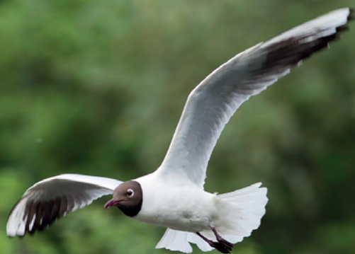
Naurulokki pesii Hähkäjärvellä. PK