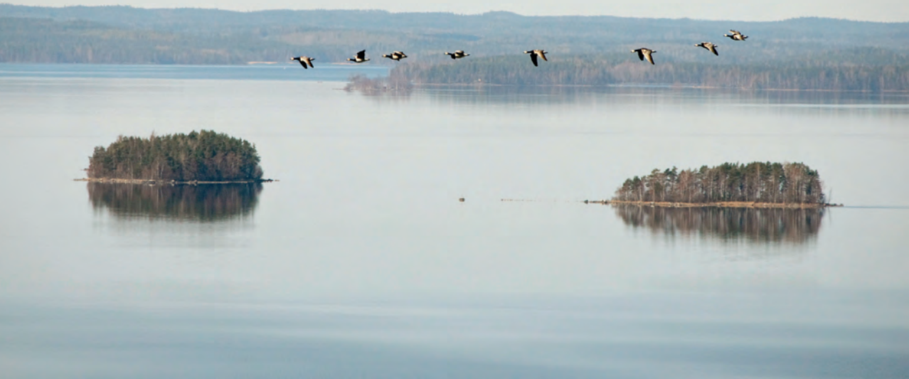
Muuttavia valkuposkivanhia kuvattuna Päijätsalon näkötorresta. RI