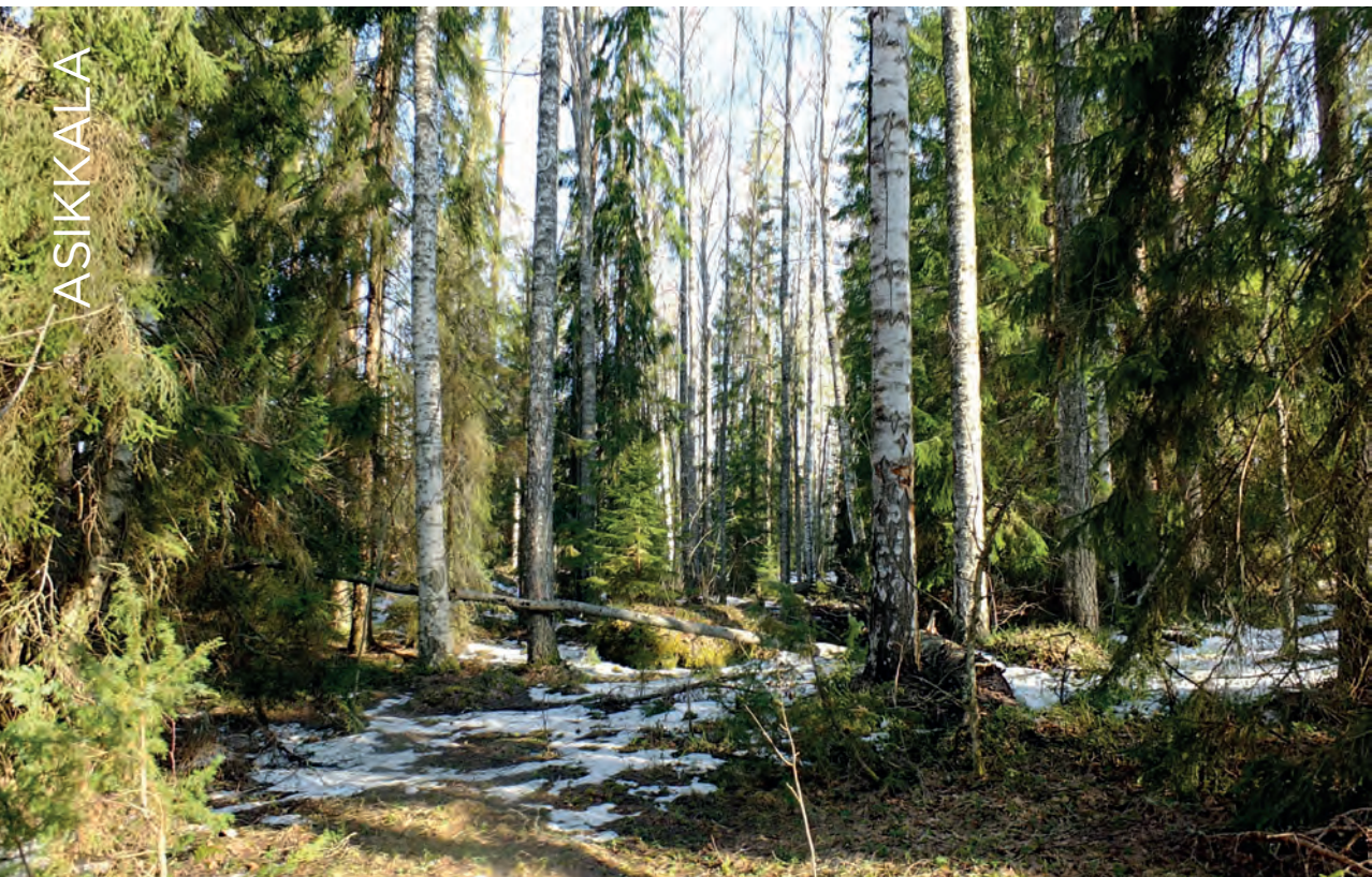
Mukkulammin metsää. PS