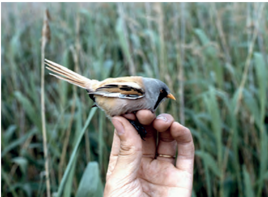
Pääjät-Hämeen ensimmäiset viiksitimalit pesivät Kutajärvellä kesällä 1991. El

varrella olevalta pysäköintipaikalta pellon reunan ulkoilutietä seuraamalla. Reitti on toteutettu osan matkaa pitkospuina ja se on käyttökelpoinen ympäri vuoden. Lintutornista näkee lähes koko järven. Kävelymatkalla voi kesäisin kuulostella lehtojen lintuja, joita on tarjolla edustava valikoima. Reitin varrelle on pystytetty toinenkin lintujenkatse-lupaikka, ”länsipään lava”, joka on jäänyt puuston katveeseen, mutta soveltuu hyvin kosteikkoalueen yölintujen kuunteluun.