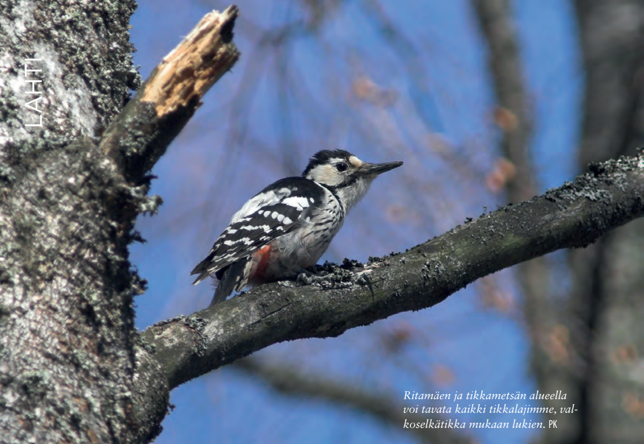
Ritamäen ja tikkametsän alueella voi tavata kaikki tikkalajimme, valkoselkätikka mukaan lukien. PK