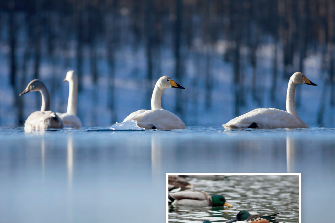
Talvehtivia laulujoutsenia sekä lapasorsa sinisorsien joukossa. PK