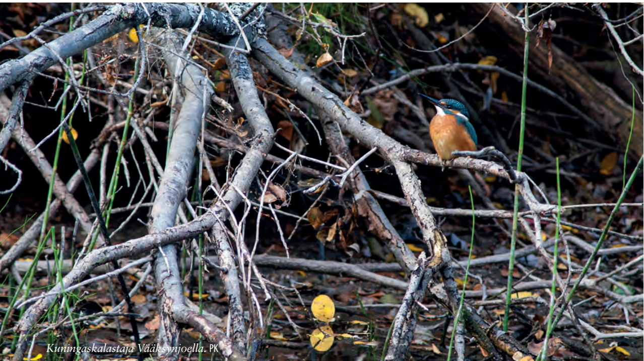
Kuningaskalastaja Vääksynjoella. PK