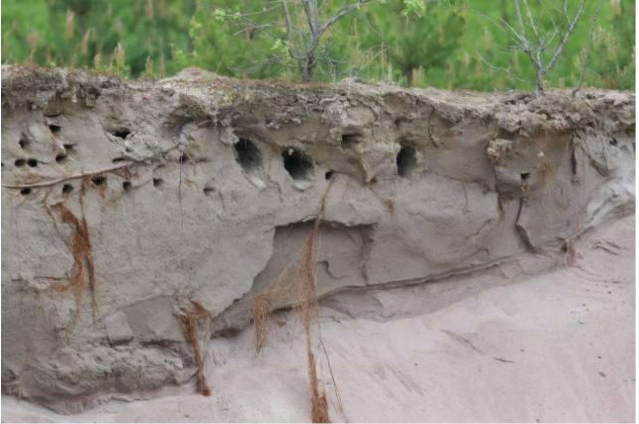
Kuva 1. Kesän 2017 E-montun pääkolonian itäreunan tömpääskykoloja.