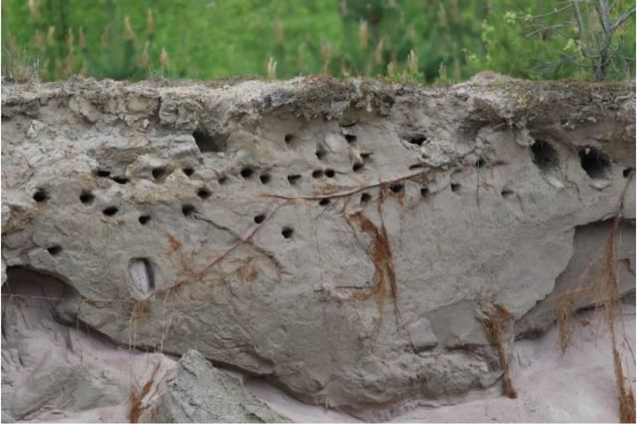
Kuva 2. Kesän 2017 E-montun itäpään pääkolonian tömpääskykoloja.