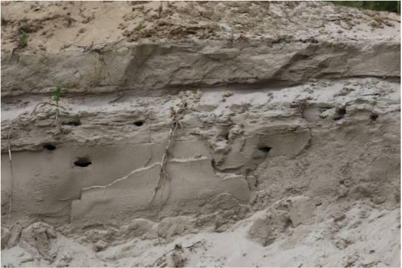
Kuva 2. Kukonkoivun törmäpääskyjen kesän 2017 pesimäkoloja E-montun keskiosassa.