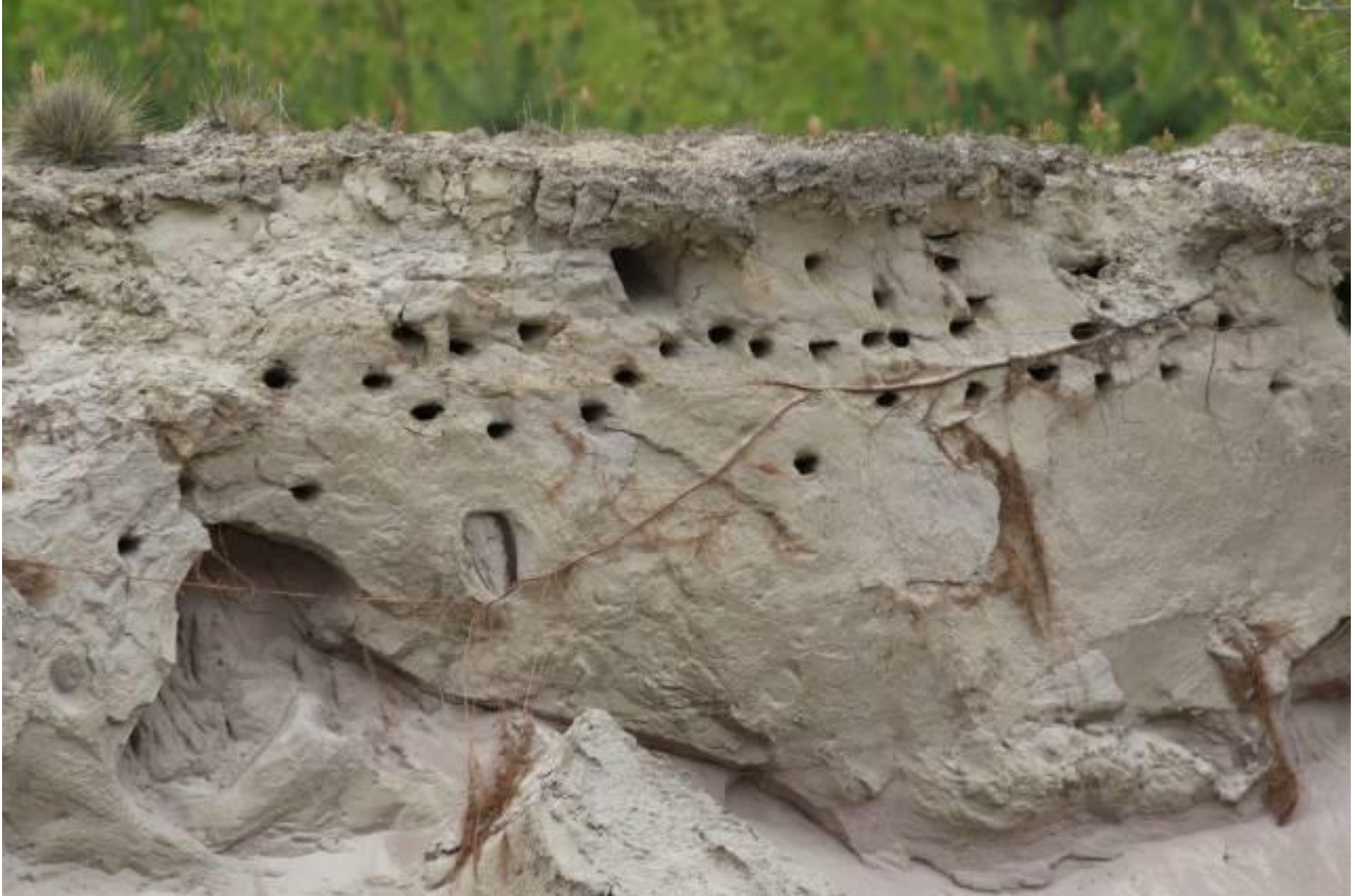
Kuva 1. Kukonkoivun törmäpääskyjen kesän 2017 pääkolonia vanhan E-montun E-reunatormässä.

30.5, Teilinkankaalla oli vanhan Hollolan Soran montun itäpään pohjoisseinämässä 38 tuoretta pesäkoloa. Viimevuotisen pesimärintauksen kohdalla pohjoisseinämässä oli 9 tuoreen näköistä pesäkoloa ja vanhemmassa länsirintauksessa kuusi tuoreen näköistä koloa. Lintuja ei näkynyt paikalla. Kuvat 1-3.