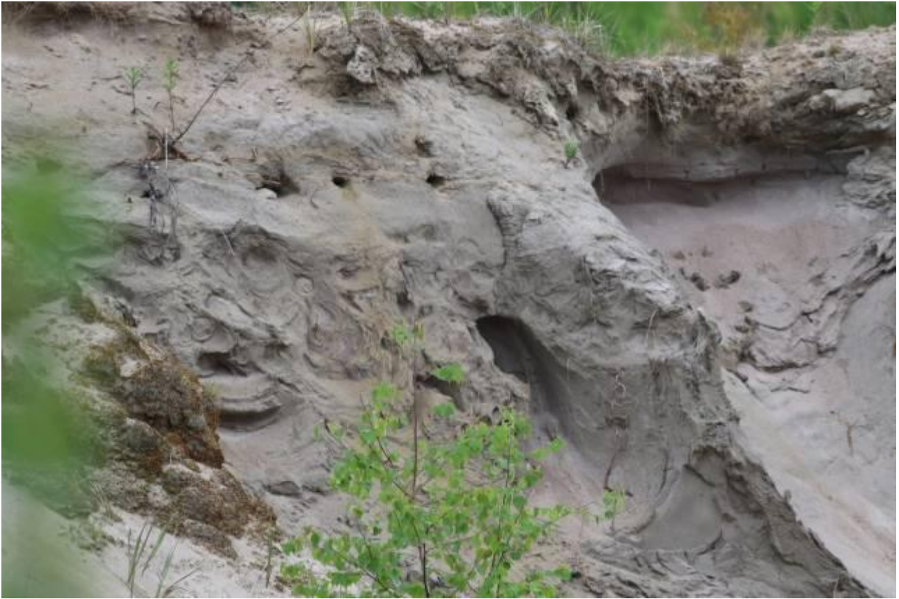
Kuva 3. Kesän 2017 E-montun itäpään pääkolonian länsireunan törmäpääskykoloja.