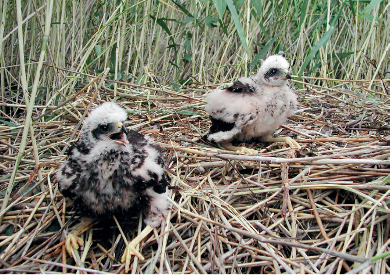
Ruskosuohaukka . El

Pesimäkauden jälkeen ruovikkoalue hiljenee. Uikut, sotkat ja osa nokikanoista siirtyvät ympäristön matalille vesille. Sotkat ja telkät viihtyvät ruovikkoalueen ja sen itäpuolella olevien saaren välissä, jossa niitä tavataan myös keväällä ja alkukesällä. Keväisin paikalle kerääntyy myös uiveloita. Nokikanat oleskelevat loppukesästä alkaen ruovikon avoveden puoleisten reunojen tuntumassa. Silkkiuikut siirtyvät selkävesille. Itse ruovikkoalue houkuttelee syksyisin vaihtelevia määriä haapanoita, taveja ja sinisorsia. Merimetsot käyttävät selkäveden puolella olevaa pientä Kiviluodon saarta keskikesästä lähtien tukihohtanaan, josta käsin ne tekevät ruokailulentoja Laitialanselälle.