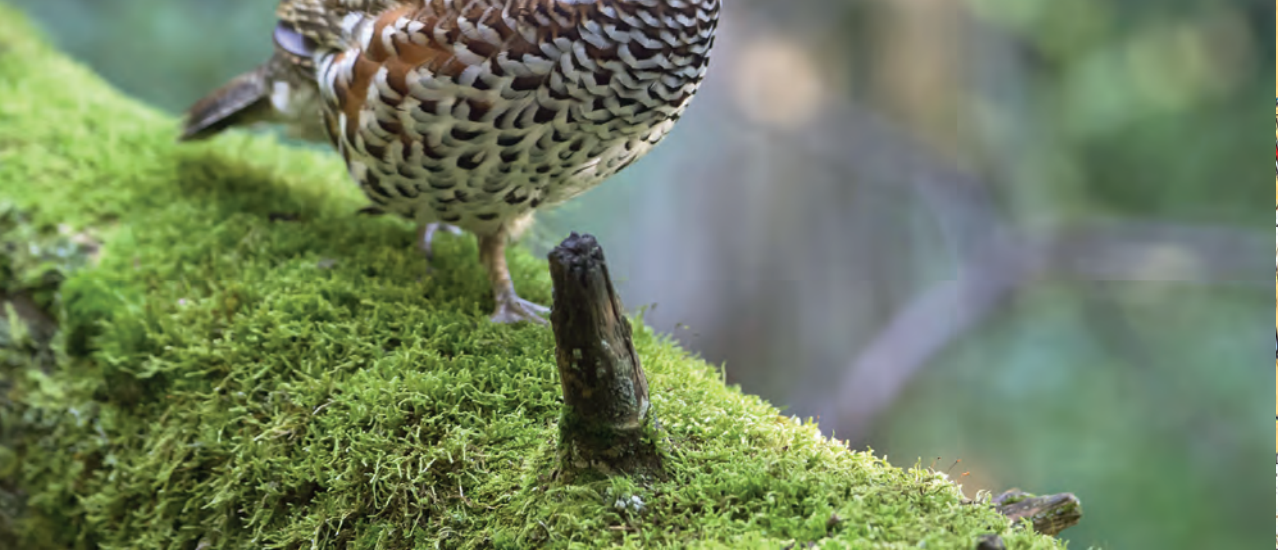
Suojelumetsät ovat oivallista ympäristöä pyylle. SS