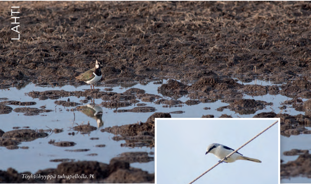
Töyhtöhyppä tulupelloilla. PK